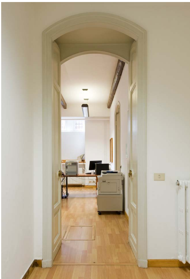
FOTO - Interno PICTURES - Interiors