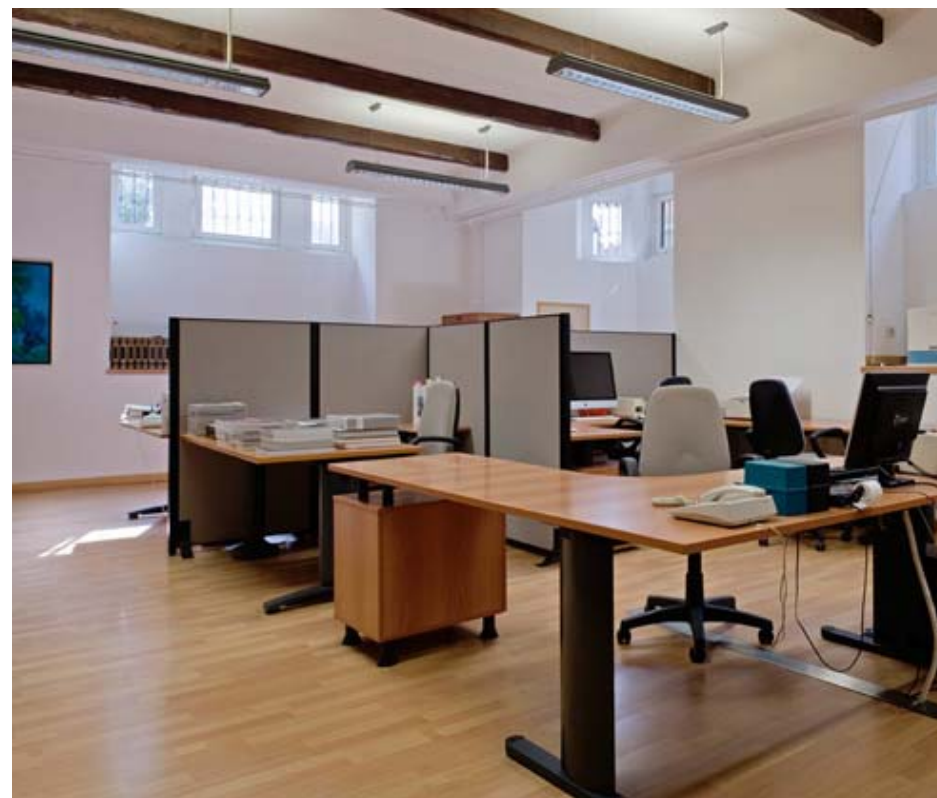
Sopra e a lato: Vista ingresso e ufficio open space. Above and side: View entrance and open space office.