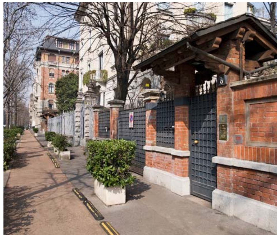
Sopra e a lato: Facciata principale del palazzo e ingresso. Above and aside: Facade of the building and entrance