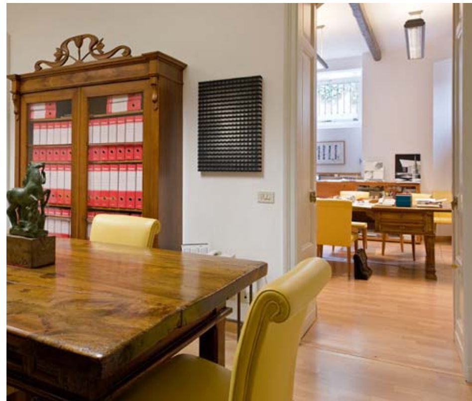
Sopra e a lato: Vista ufficio e sala riunioni. Above and side: View office and meeting room.