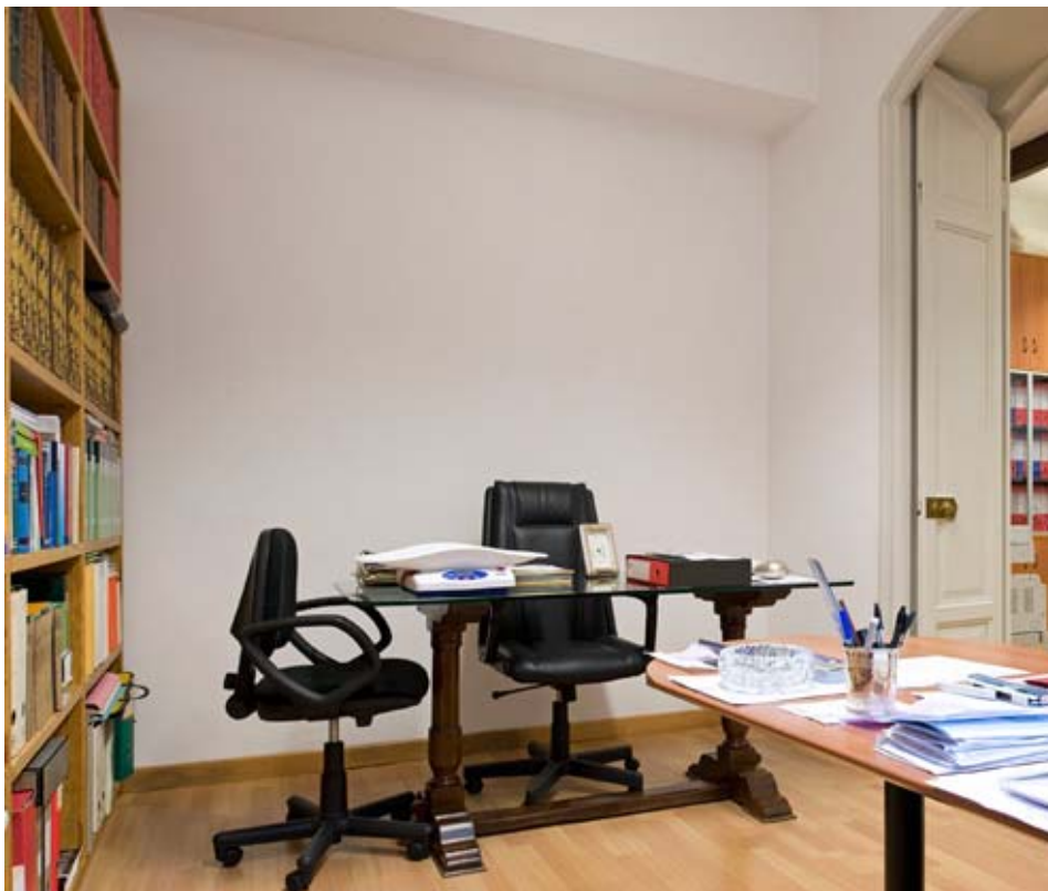
FOTO - Interno PICTURES - Interiors