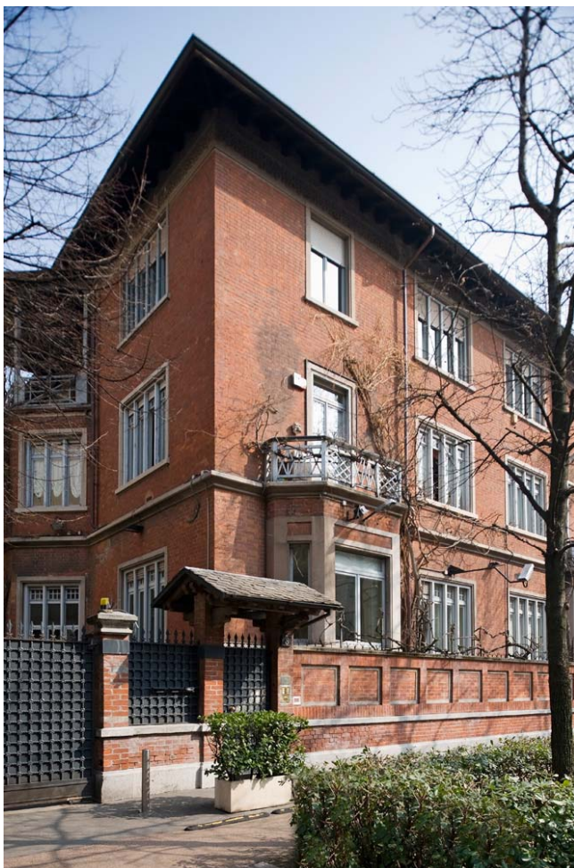
FOTO - Esterno PICTURES - Exterior