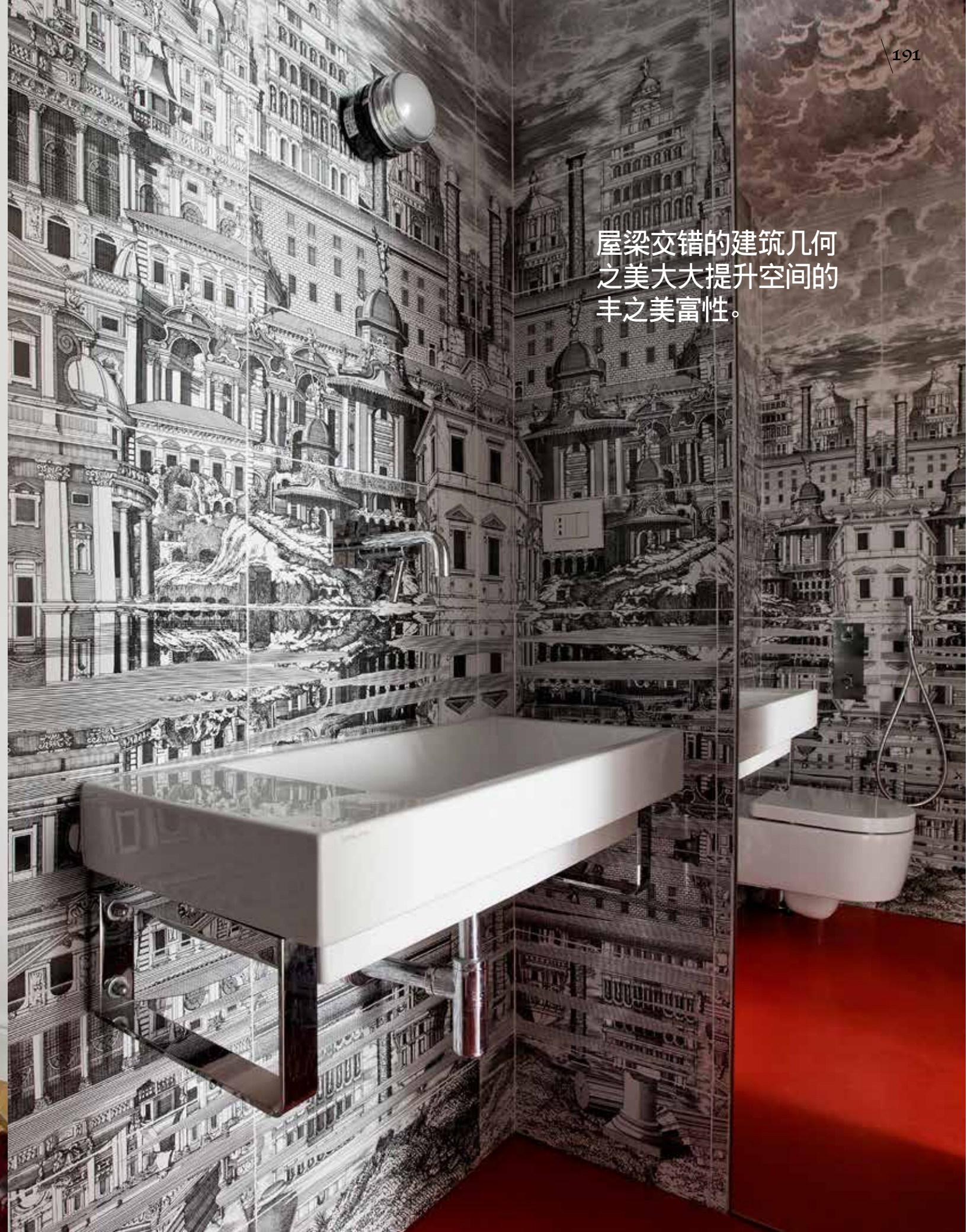
屋梁交错的建筑几何之美大大提升空间的丰之美富性。