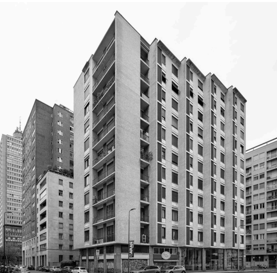
fotografia del condominio di via Locatelli di Sosthen Hennekam